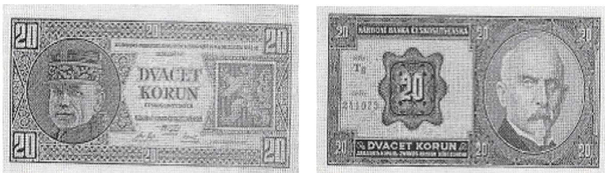
avers a revers bankovky z roku 1926, na reversu portrét Aloise Rašína