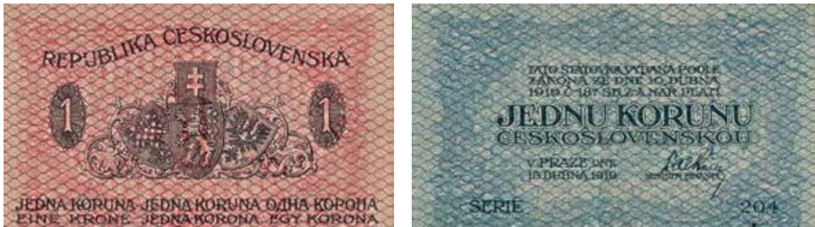
avers a revers státočky z roku 1919