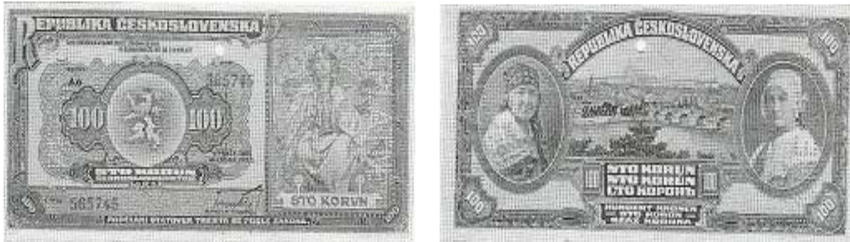
avers a revers státočky z roku 1920